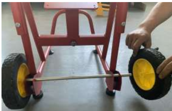
Рис. 3 – Установка колес