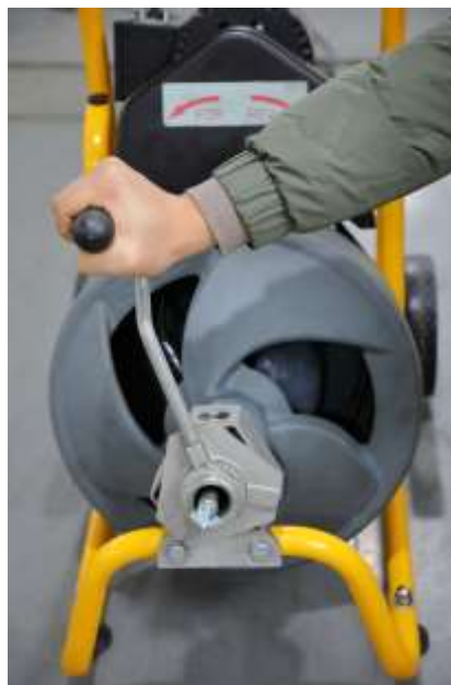
Рис 6 – В рабочем положении, подаваемая вручную спираль

Такое рабочее положение может сохранять управление тросом и прочистной машиной. (См. рис. 6.)