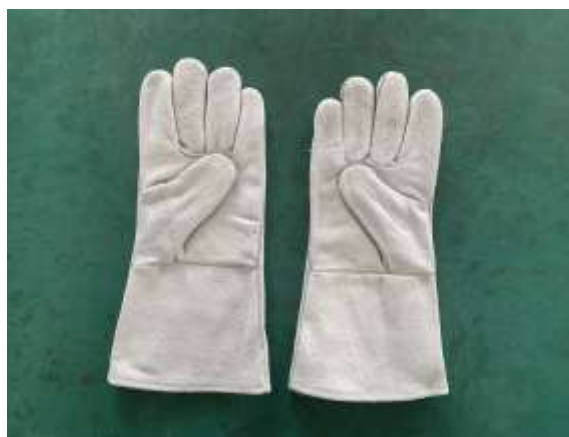
Рис. 4 – Перчатки для чистки канализации HONGLI